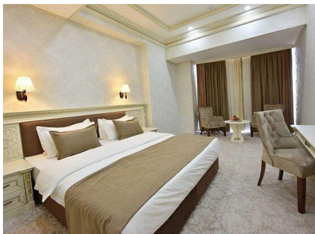
FOTO DELL'HOTEL DI TAŠKENT

SCONTO DI 50,00 EURO PER ISCRIZIONI ENTRO IL 28 FEBBRAIO