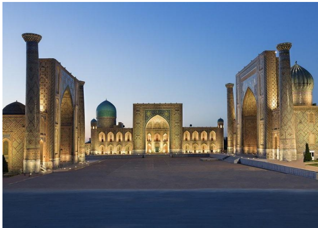
FOTO DI SAMARCANDA, BUKHARA, KHIVA